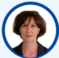
ISABELLE FACON FRS