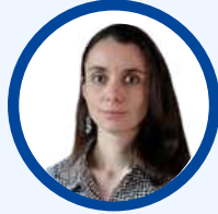
EMMANUELLE MAITRE FRS