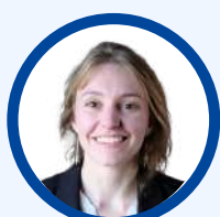
ANNABELLE LIVET FRS