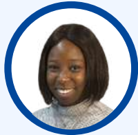
DJENABOU CISSE FRS