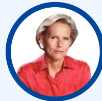
CHRISTINE OCKRENT FRANCE CULTURE