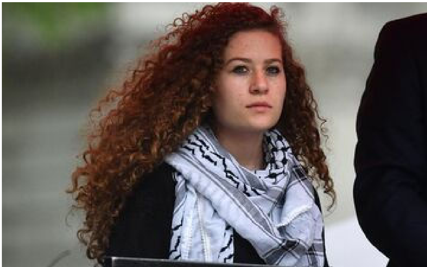
Ahed Tamimi, jeune icône palestinienne, arrêtée par l'armée israélienne pour « incitation au terrorisme »