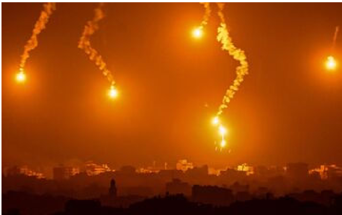
Guerre Israël-Hamas : frappes « significatives » et Gaza coupé en deux, l'offensive de Tsahal s'intensifie