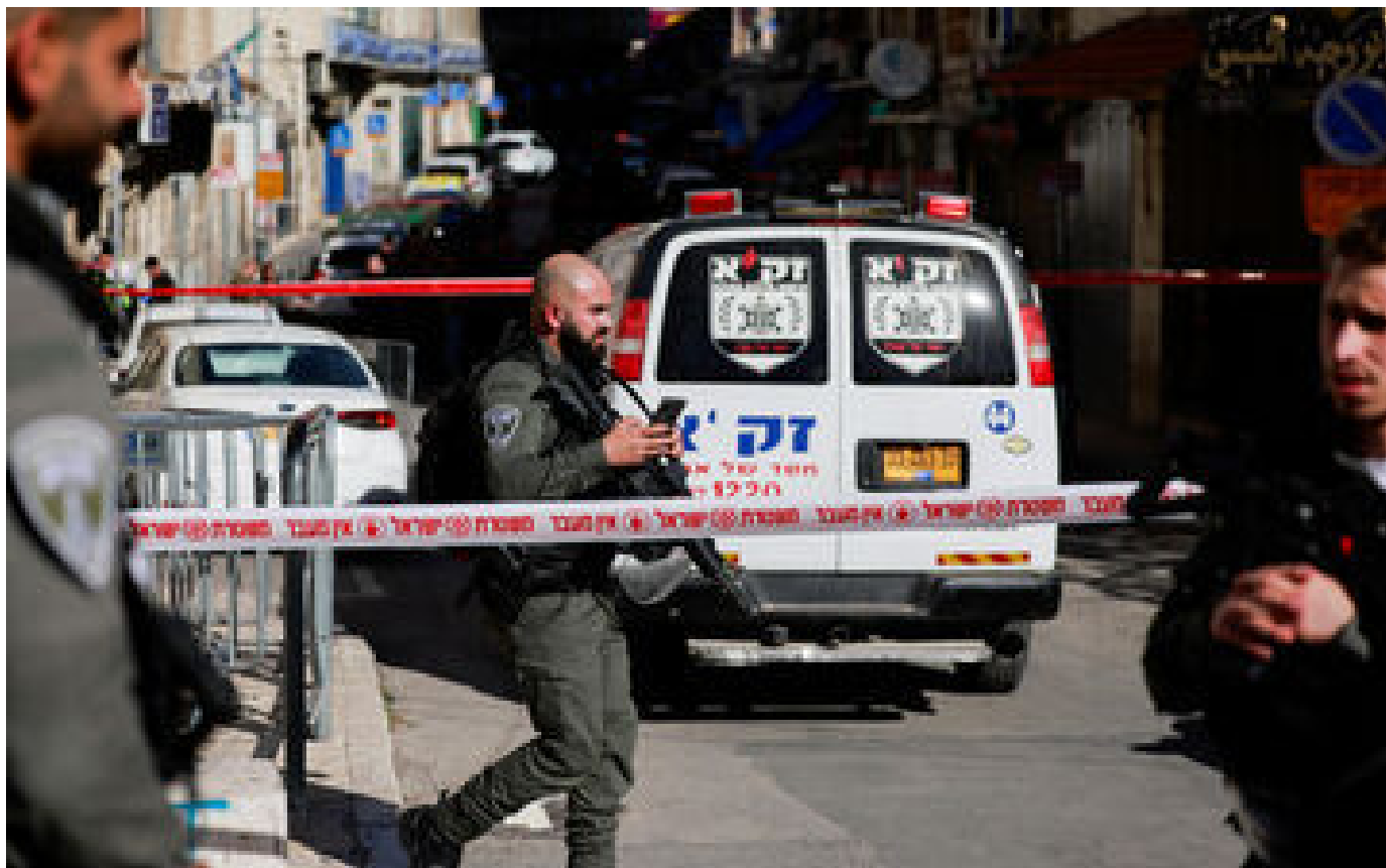
Attaque au couteau à Jérusalem-Est : une soldate israélienne grièvement blessée, l'assaillant tué