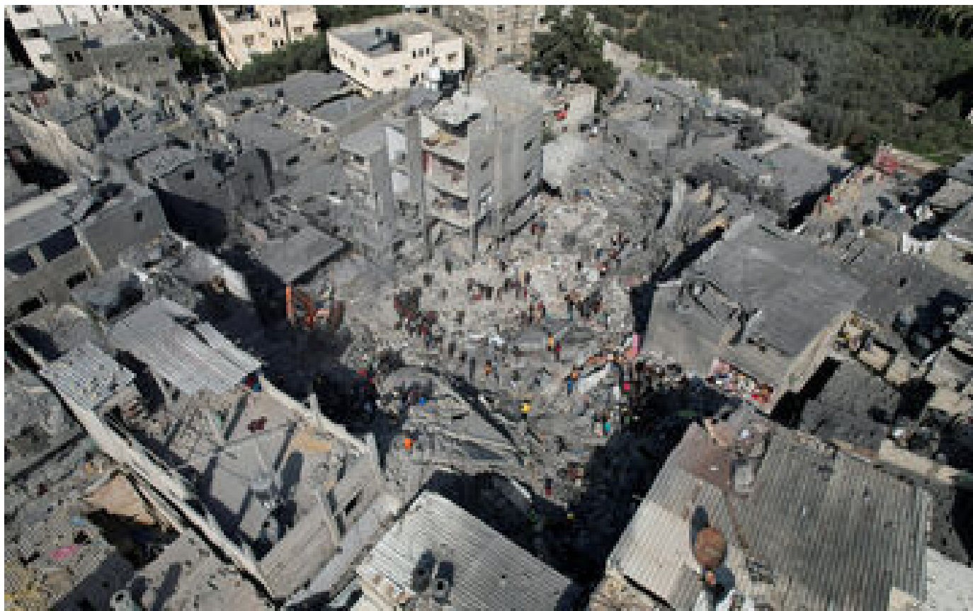
L'armée israélienne accuse le Hamas, images à l'appui, de tirs depuis des hôpitaux de Gaza