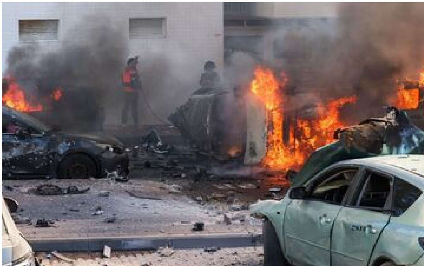
Attaque du Hamas : 40 Français ont été tués en Israël et huit sont disparus, selon un nouveau bilan