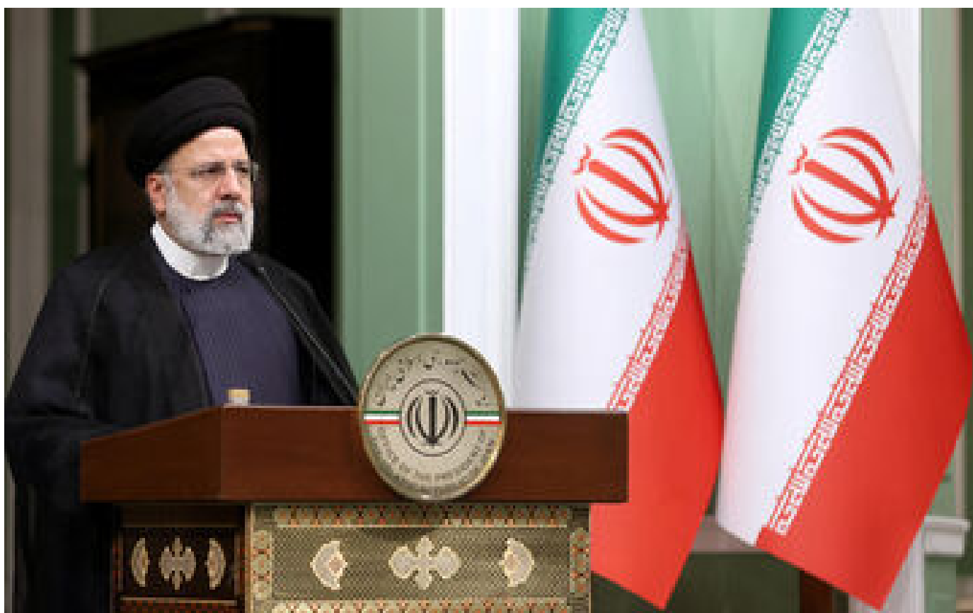
Guerre Israël-Hamas : le président iranien accuse les États-Unis d'« encourager à tuer »