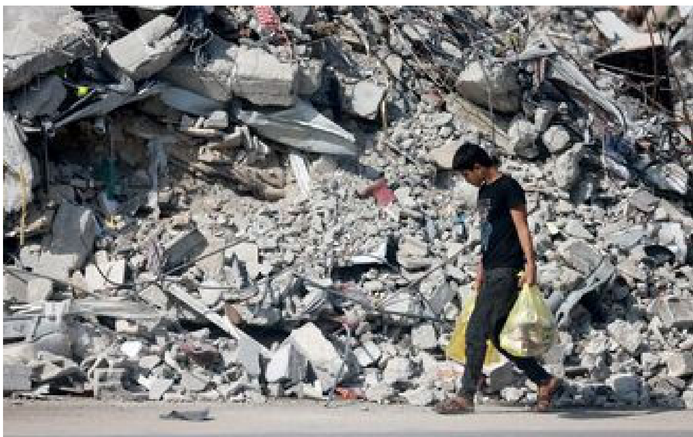
DIRECT. Guerre Israël-Hamas : l'UE annonce une aide supplémentaire de 25 millions d'euros pour Gaza