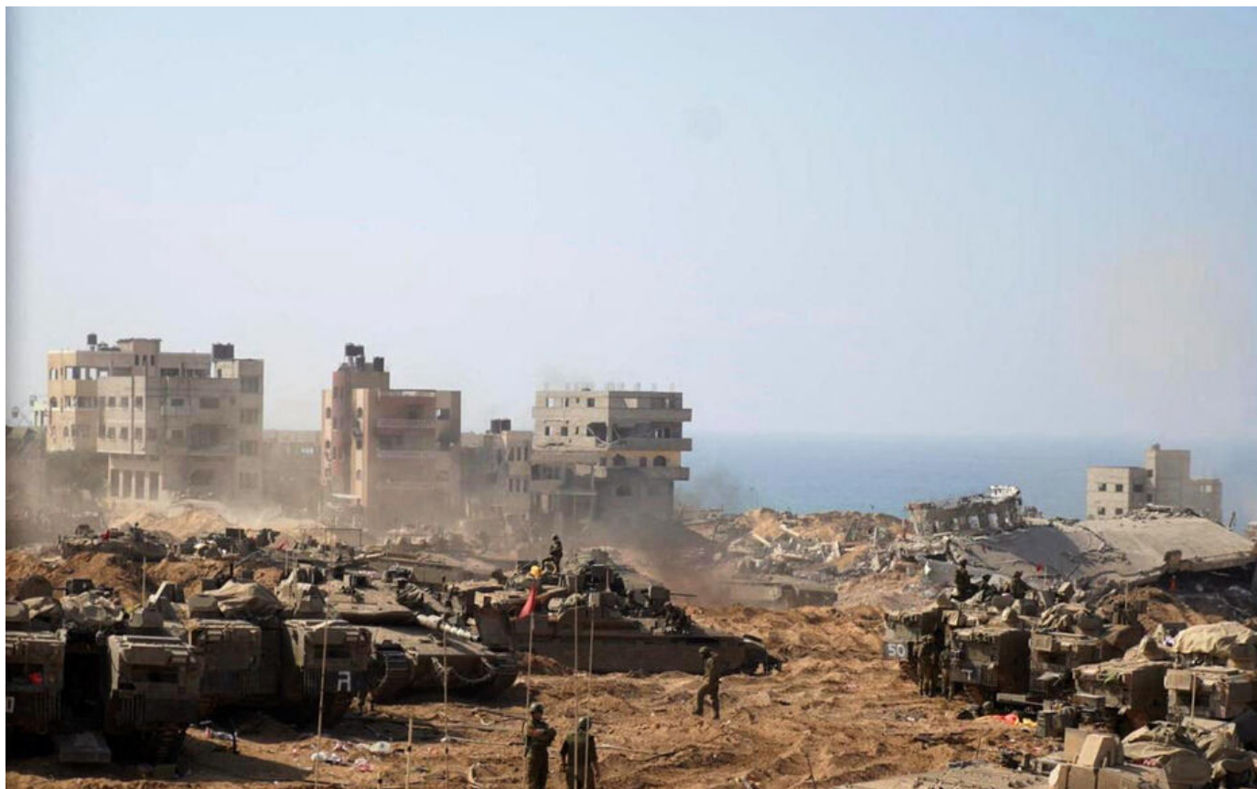
Des chars et des soldats israéliens stationnés dans le nord de la bande de Gaza le 5 novembre 2023.