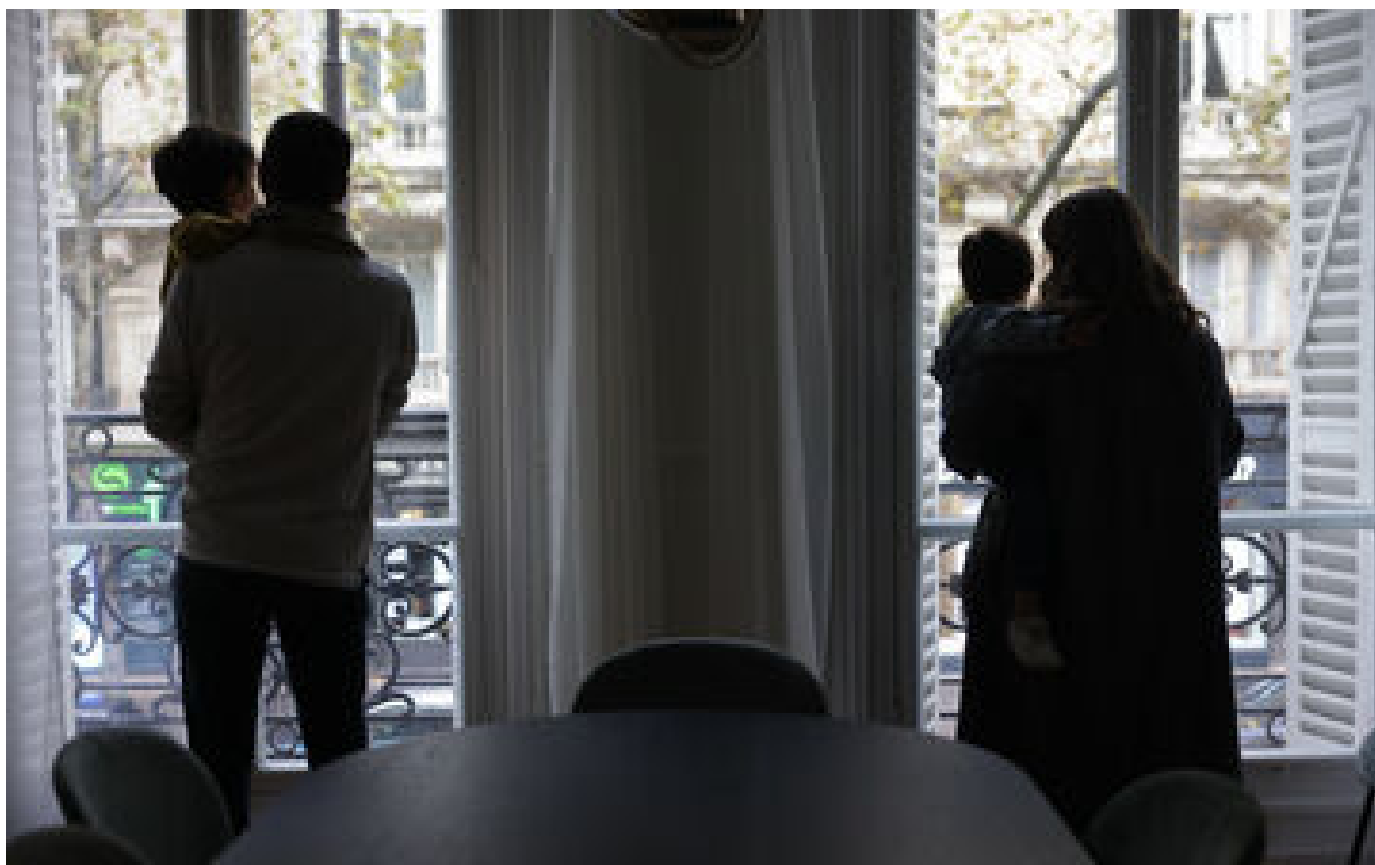
Guerre Israël-Hamas : ces familles israéliennes qui ont trouvé refuge en France