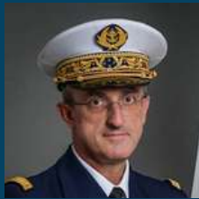
Amiral Nicolas Vaujour, chef d'état-major de la Marine nationale française