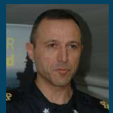
Ammiraglio di squadra Andrea Gueglio - ammiraglio ispettore capo del corpo di stato maggiore della Marina militare italiana