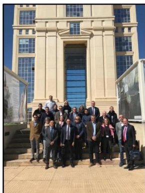
Conseil Régional d'Occitanie