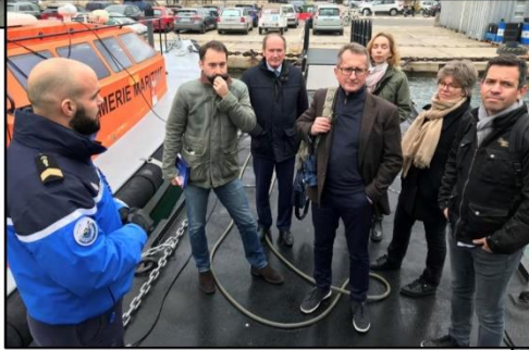
Gendarmerie maritime à Toulon