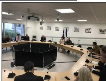
Secrétariat Général pour les Affaires Européennes