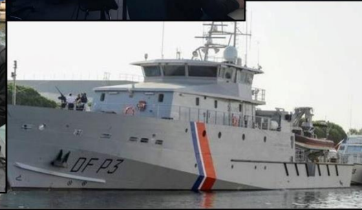
Douanes garde- côtes à La Seyne sur Mer

Les enjeux de défense et de sûreté ont fait l'objet d'une attention toute particulière. L'espace maritime en raison de ses caractéristiques physiques et juridiques est un espace de rapports de force, de confrontation entre les Nations et d'activités illicites. Interface entre trois continents, la Méditerranée se prête particulièrement bien à l'analyse stratégique des menaces de défense et de sûreté de notre monde contemporain.