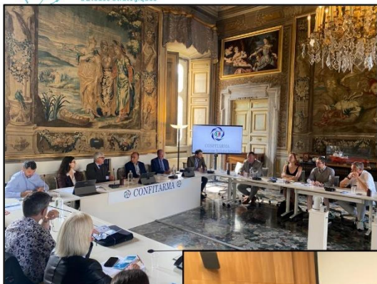
Federazion del Mare