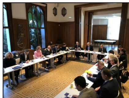
Parlement de la mer d'Occitanie