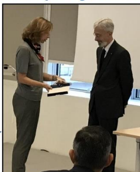
Secrétariat Général de la Mer