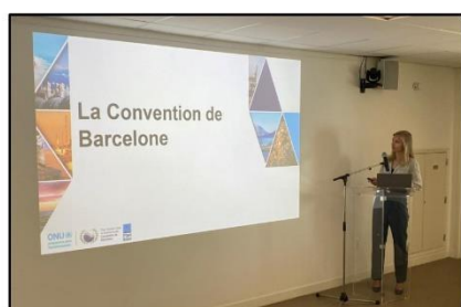
Convention de Barcelone