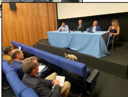
Ambassade de France