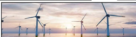
Séminaire éolien en mer à Carnon