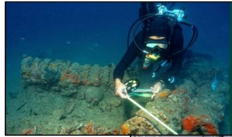
DRASSM à Marseille