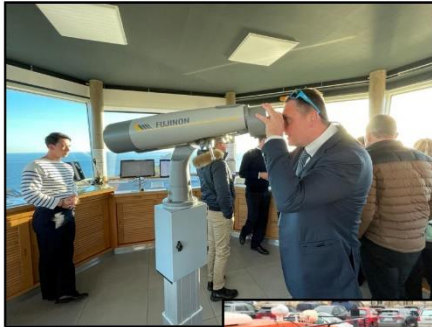
Sémaphore de La Parata en Corse