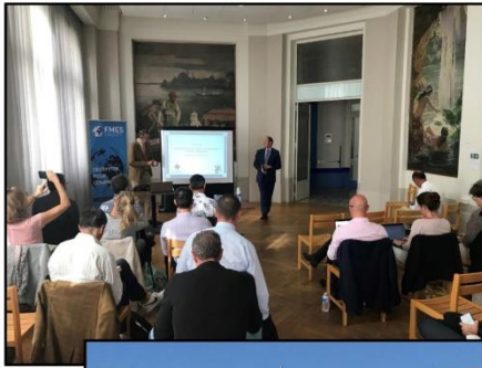
Perspectives historiques et géopolitiques