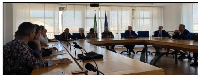
Ministère de l'environnement

Le 18 octobre prochain, les auditeurs de la 2 ème session maritime méditerranéenne se retrouveront à Toulon pour la séance inaugurale d'une année d'études qui s'annonce aussi riche et passionnante que l'édition 2022-2023. Leurs thèmes de travaux de comités porteront sur « Quelle surveillance maritime demain pour garantir la maîtrise des espaces maritimes méditerranéens ? »