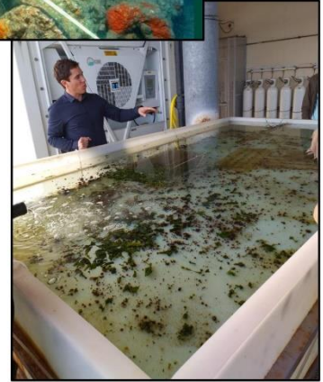
Stella Mare à Bastia

Enfin un voyage d'études en Italie a été organisé pour une étude comparée des politiques publiques maritimes françaises et italiennes. Reçus à l'ambassade, les auditeurs ont bénéficié d'un tour d'horizon complet des relations entre les deux pays dans les domaines de la défense, de la sécurité intérieure, de l'économie et de la protection de l'environnement. Une visite de la Guardia Costiera a permis d'aborder les sujets du sauvetage en mer, de la surveillance du trafic maritime et plus largement de la sécurité en mer. La stratégie italienne de préservation de l'environnement en mer nous a été présentée par le directeur de la protection de l'environnement du ministère de l'environnement. L'économie bleue italienne a enfin été détaillée lors d'une visite à la Federazione del Mare .