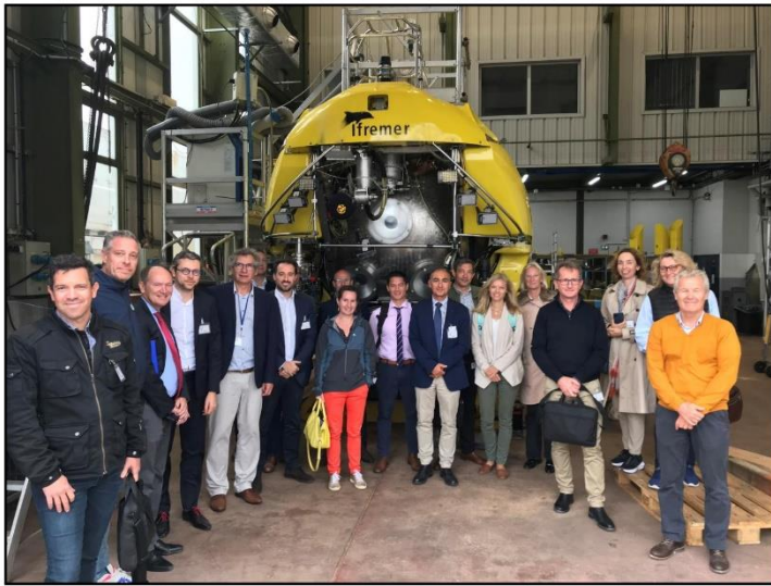
IFREMER à La Seyne sur Mer